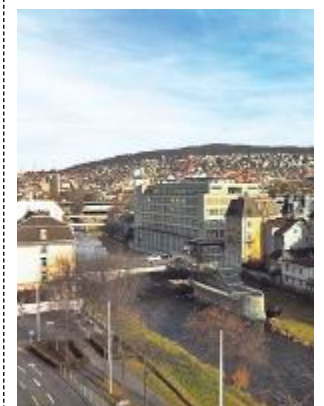
Aussicht von 20-Minuten-Terrasse.

Wir haben es Ihnen vorgemacht. Toppen Sie unseren Wohlfühl-arbeitsort. Senden Sie ein Foto Ihrer Arbeitsplatzaussicht an community@20minuten.ch