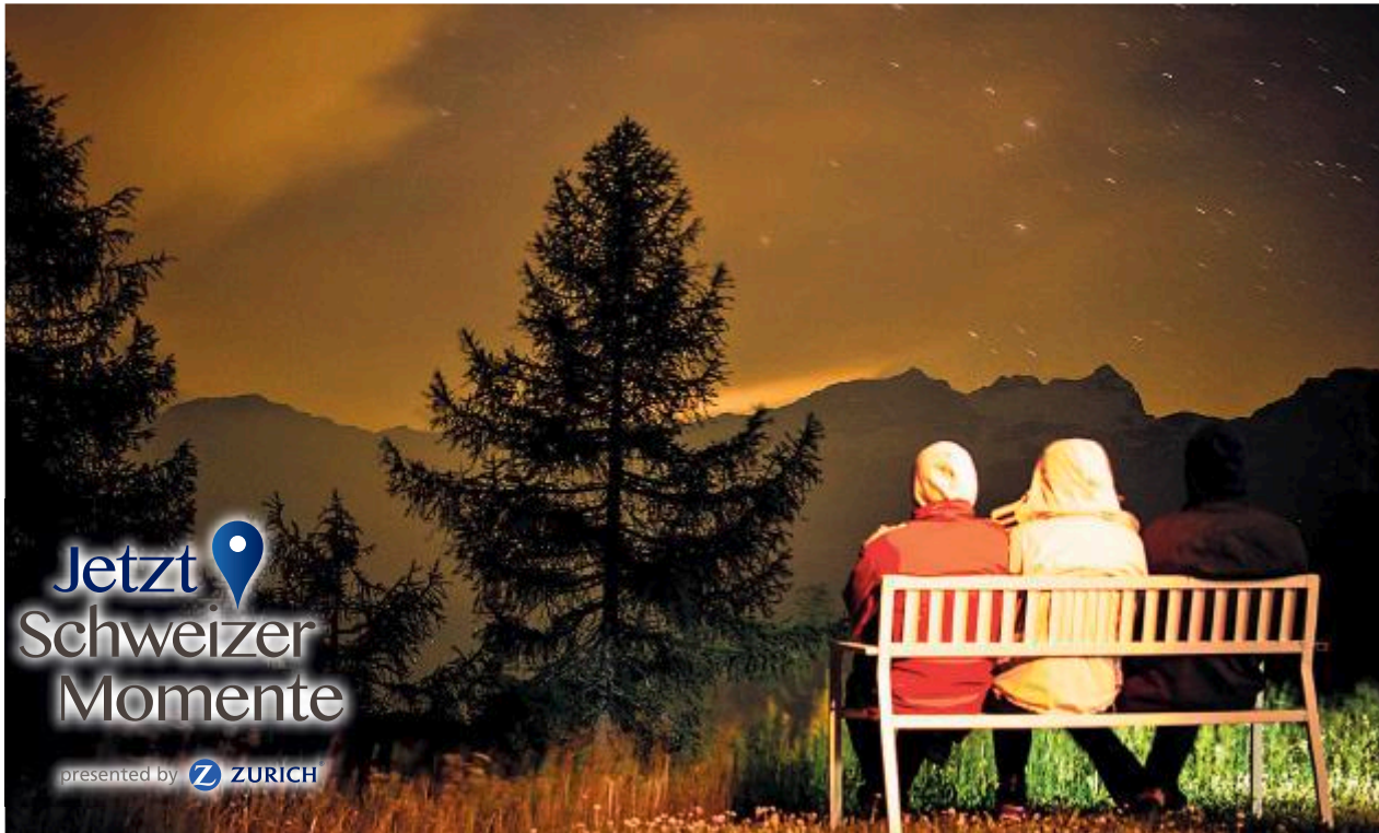
Biho Song landete mit seinem Bild vom Schweizer Sternenhimmel beim Wettbewerb «Jetzt – Schweizer Momente» auf dem ersten Platz.