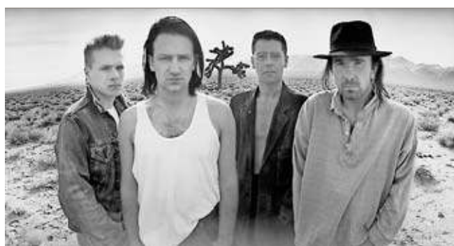
Anton Corijin fotografierte U2 in der Wüste Mojave.