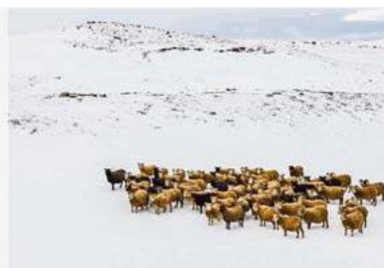
Landschaft und Architektur: Bildpaare von Wilfried Segmüller.