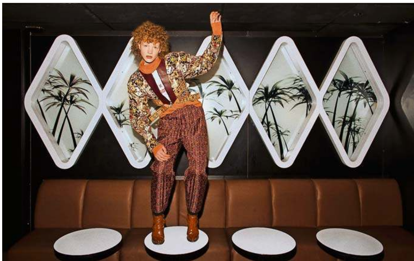
Eine der Aufnahmen des Zürcher Modefotografen Walter Pfeiffer, der an der Photo 17 den Lifetime Award erhält.

Etlche bekannte Namen sind auch in der Werkschau vertreten. Zum wiederholten Mal mit dabei sind zum Beispiel der international anerkannte Zürcher Musikfotograf Lukas Maeder, der preisverwöhnte Zürcher Werbe- und Reportagefotograf Noë Flum so-