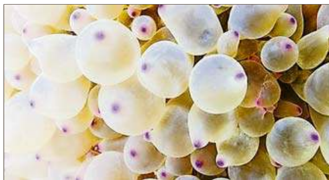
Unterwasserwelten von Fabienne Wheeler Kroumi.