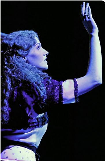
Im Februar: «Phantom der Oper». PD

Ort: Volkshaus, Stauffacherstr. 60 Datum: Sa, 21.1. um 20 Uhr