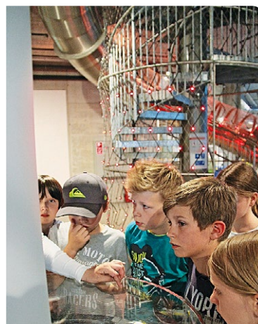
Familientage in der Umwelt-Arena. PD

Ort: Maag-Halle, Hardstrasse 219 / Datum: Fr, 6.1., bis Di, 10.1. (11–20 Uhr)