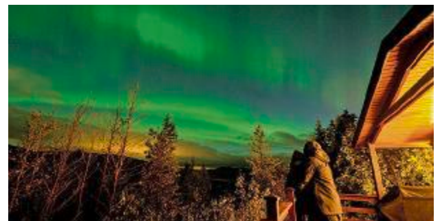
Für Leser Simon war der Anblick der Nordlichter ein Glücksmoment.