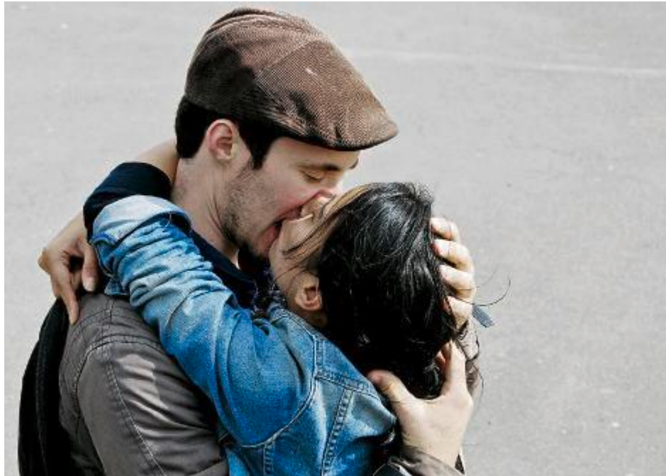
Wenn der Altersunterschied gross ist, empfiehlt Dr. Sex, sich genügend Freiraum zu lassen.

«Deine Freundin ist nicht mehr im Schutzalter, daher gibt es rein juristisch gesehen keine Probleme. Trotzdem sind zehn Jahre ein ziemlicher Altersunterschied. Es ist daher wichtig, dass ihr euch genügend Freiraum lasst. So könnt ihr die Dinge tun, die euch