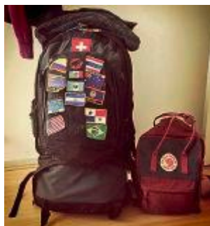
Reisen macht Deborah glücklich.

der kommenden Werkschau «Photo16» ausgestellt. Zudem kämpfen diese 100 Fotos im Duell um den Hauptpreis: eine Nikon D7200 (Kit mit Objektiv AF-S DX Nikkor 18-105 VR) im Wert von 1448 Franken. 20M